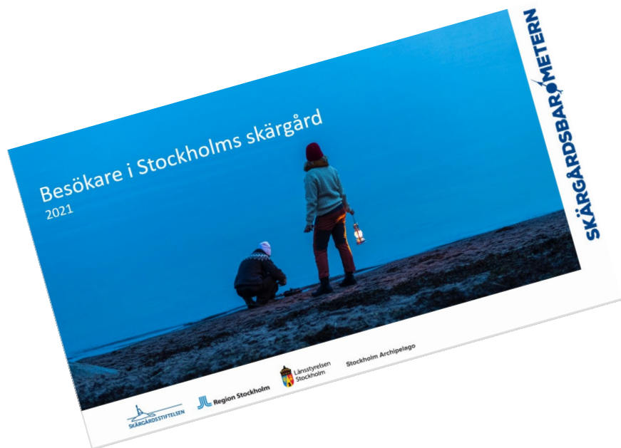
Hela skärgården, helår

2021 års besöksantal låg mellan 2019 och 2020 års nivåer