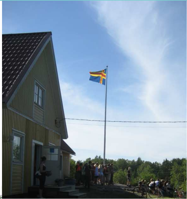
Klockkulla med den åländska flaggan hissad