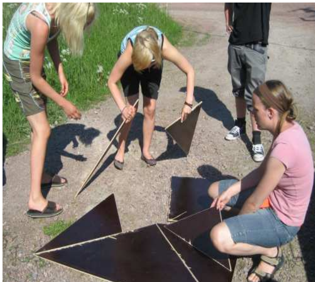
Hjärgymnastik i grupp