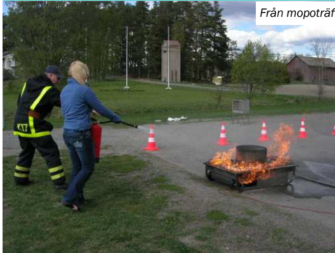
Från mopoträffen i Kimito