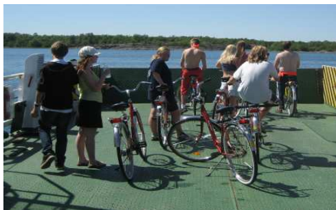
Cykeltur till Björkö