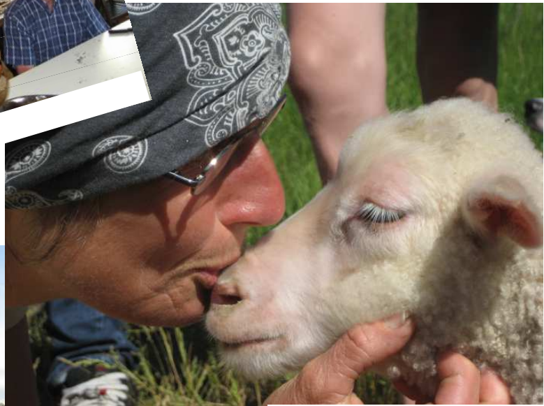
Love you fårever