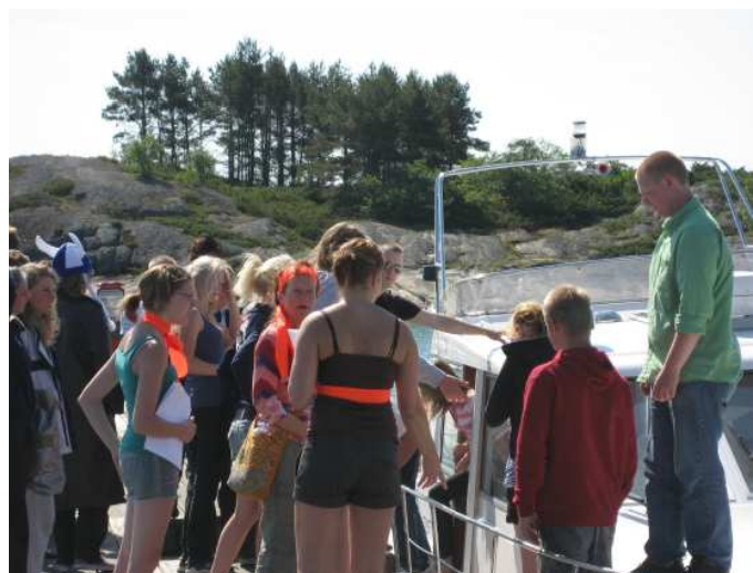
Svenskarna landstiger på Lappo