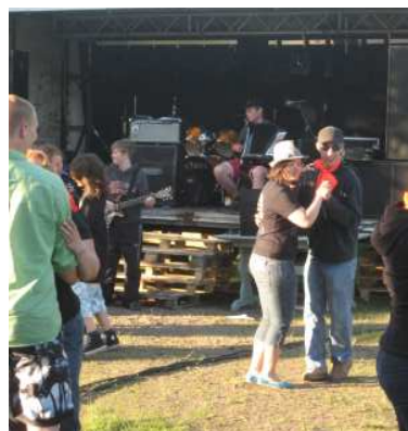
Trots värmen dansades det på flera håll och givetvis blev det också en finsk jenka