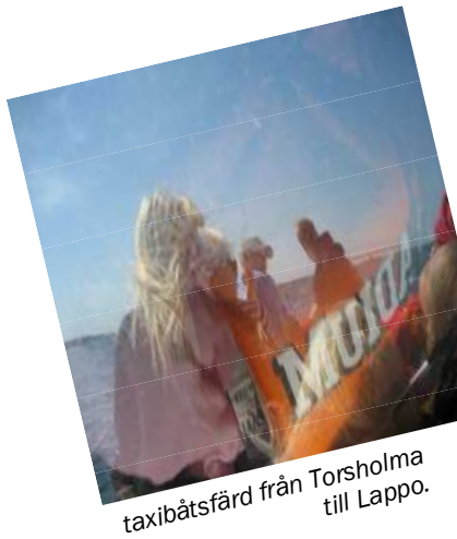
taxibåtsfärd från Torsholma till Lappo.