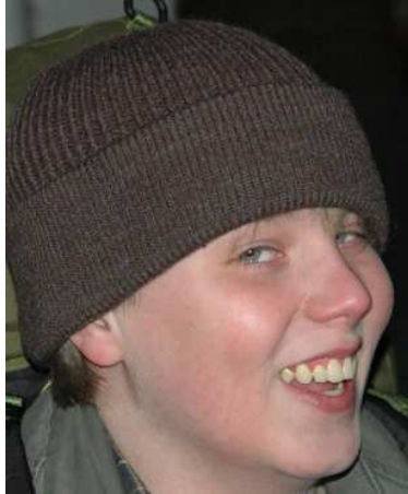
Skrattar eller grinar han?