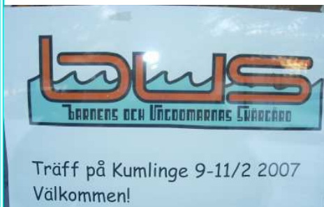
"BUS = vi"