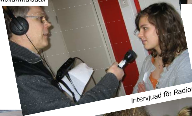
Intervjuad för Radion