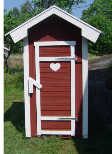
Gå på utetuppen eller utedasset?