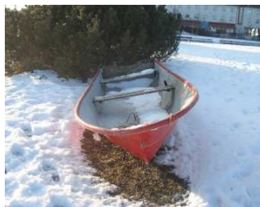
Livräddningsbåt på semester

Information om det åländska sjöräddningssällskapet finns på: http://www.sjoraddningen.aland.fi/