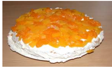
Fyllkaka eller tårta?