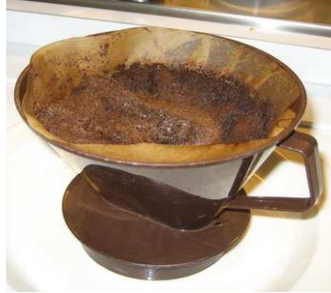
Kaffeporo, kaffeslask eller kaffesump