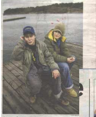
Skärgården behöver fler unga Skärgårdsprojektet har fått mycket uppmärksamhet i media. Här ses några av de unga som deltar i projektet.