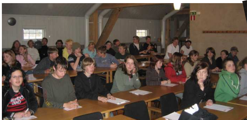
Konferens på Vaxholms Kastell