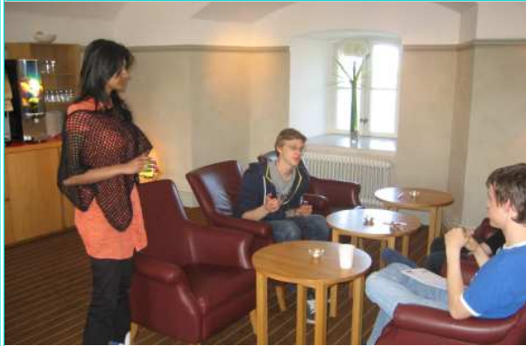
Gruppdiskussion med SIP