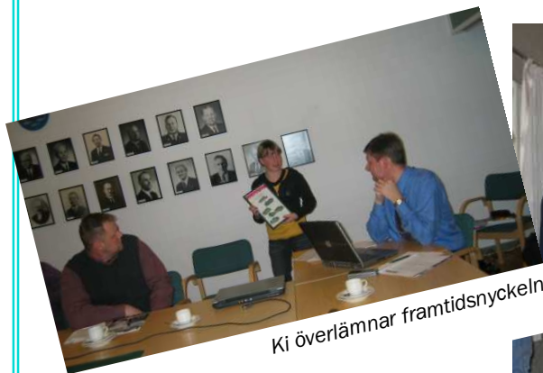
Ki överlämnar framtidsnyckeln