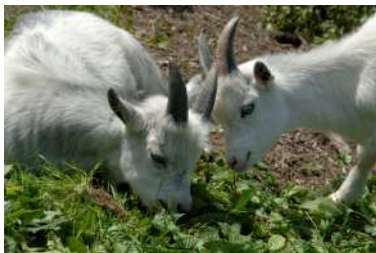
Vi saknar foton från Stensvik så denna bild är lånad från Fredriksdal museer och trädgårdar