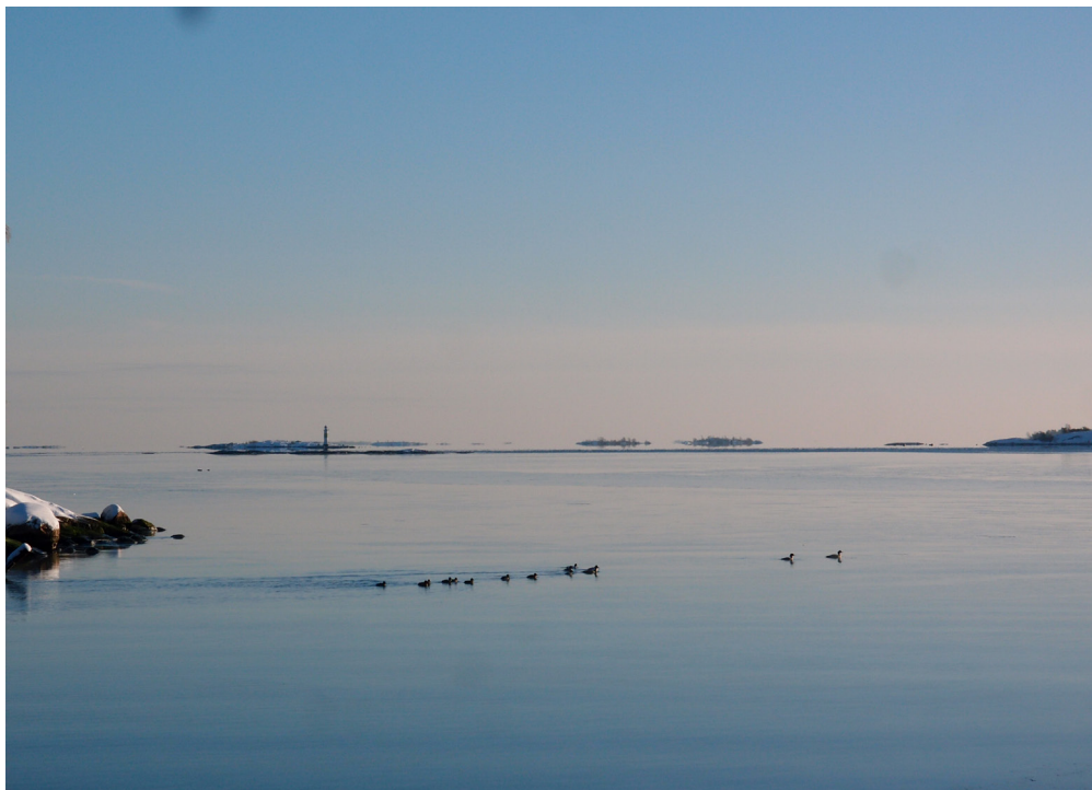
Fyren Stenkobbgrund syns i fjärran, 4 februari 2019