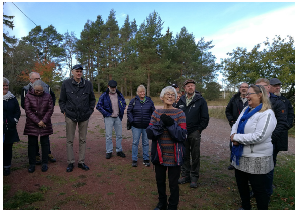
Guidning av öbor, inte minst KSO, på Kökar