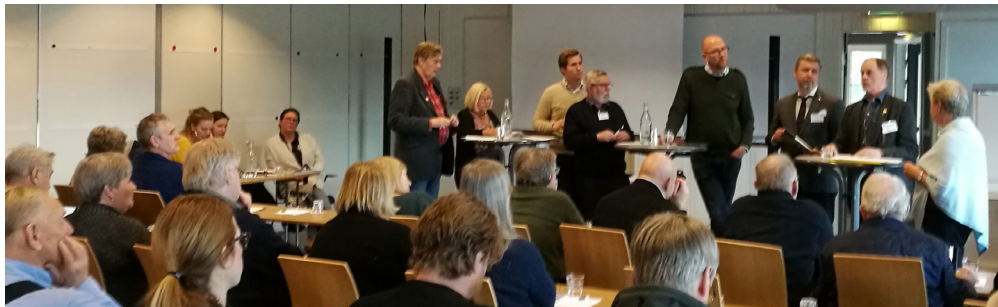
Debattpanel med Landstingspolitiker i Sandhamn på SIKO:s årsmöte 2018