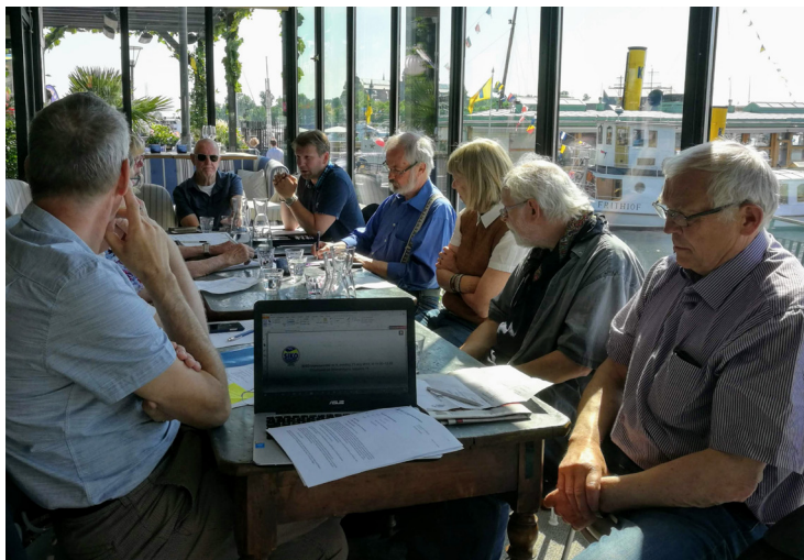
Styrelsemöte, maj 2018, hos Visit Skärgården på Strandvägskajen (Glashuset)