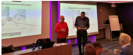
SRF tog hjälp av SIKO att planera Kökarresan

En viktig satsning under 2018 var en studieresa till Kökar på Åland, anordnad av Skärgårdarnas Riksförbund och med 13 deltagare från SIKO. På Kökar bor ca 240 personer och avstånden till fastlandet är långa. Det var mycket givande att ta del av hur kommunal service kan upprätthållas på Kökar. Intressanta jämförelser gjordes med flera svenska öar och det fanns mycket att lära.