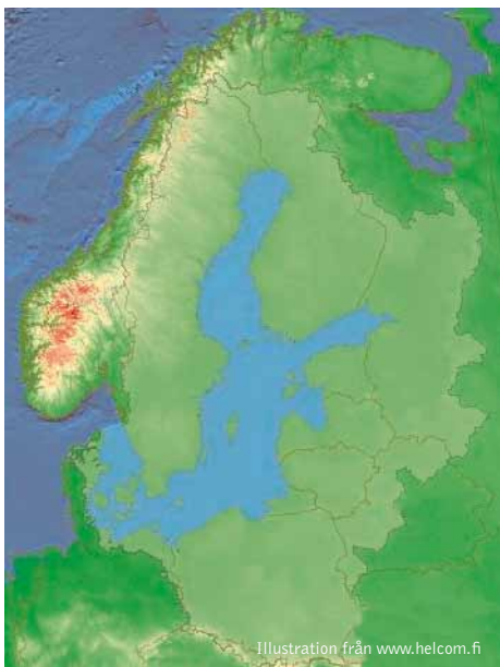
Karta över Helcom-området. Det gemensamma havsområdet är utmärkt i ljusblå färg och tillrinningsområdet i ljusgrön färg.

Inom arbetsgrupperna har mängder av data bearbetats, och det har tagits fram information om vilka arter som påträffats inom de olika havsbassängerna i Helcomområdet. Arbetet med checklistorna har tagit längre än tid än beräknat, men håller i skrivande stund på att slutföras. För evertebrater och makrofyter finns inga tidigare sammanställningar gjorda på denna nivå, så checklistorna kommer sannolikt att bli betydelsefulla underlag för många som arbetar