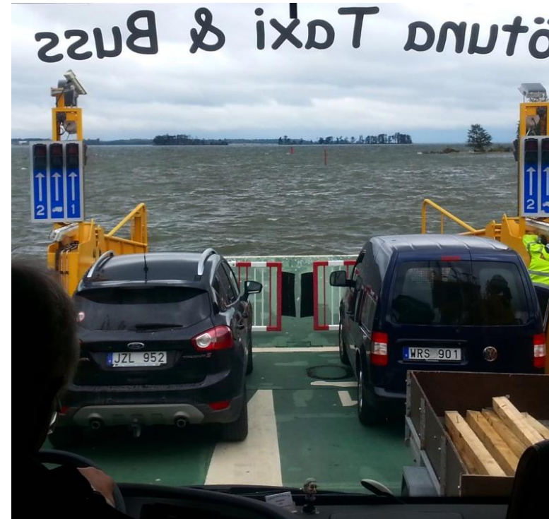
Vinöfärjan från Hampetorp till Vinön

De med intresse och roller i arbetet för en levande skärgård får gärna hänga på SIKO:s resor!