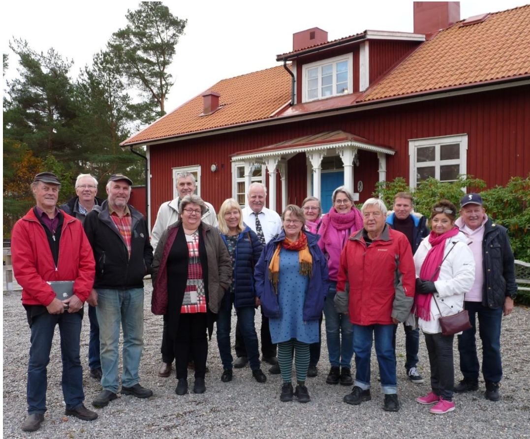
Oktober 2016 – Vinön

De med intresse och roller i arbetet för en levande skärgård får gärna hänga på SIKO:s resor!