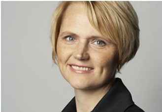
Anna-Karin Hatt, IT- och Energiminister